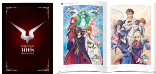
【過去の描きおろし集】